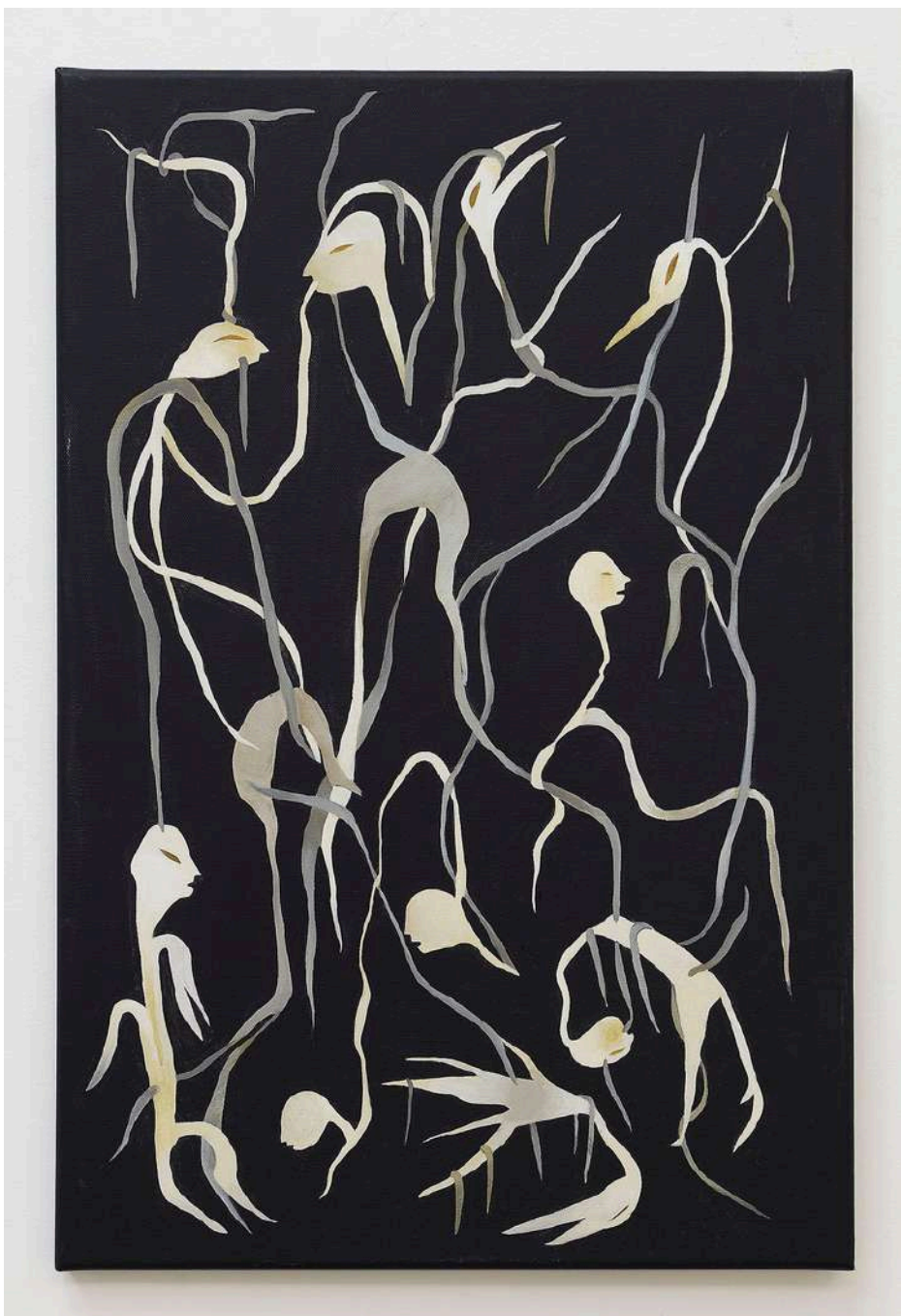
Augustin Rebetez Internal Relations #2 acrylic on canvas 40x60cm 2019