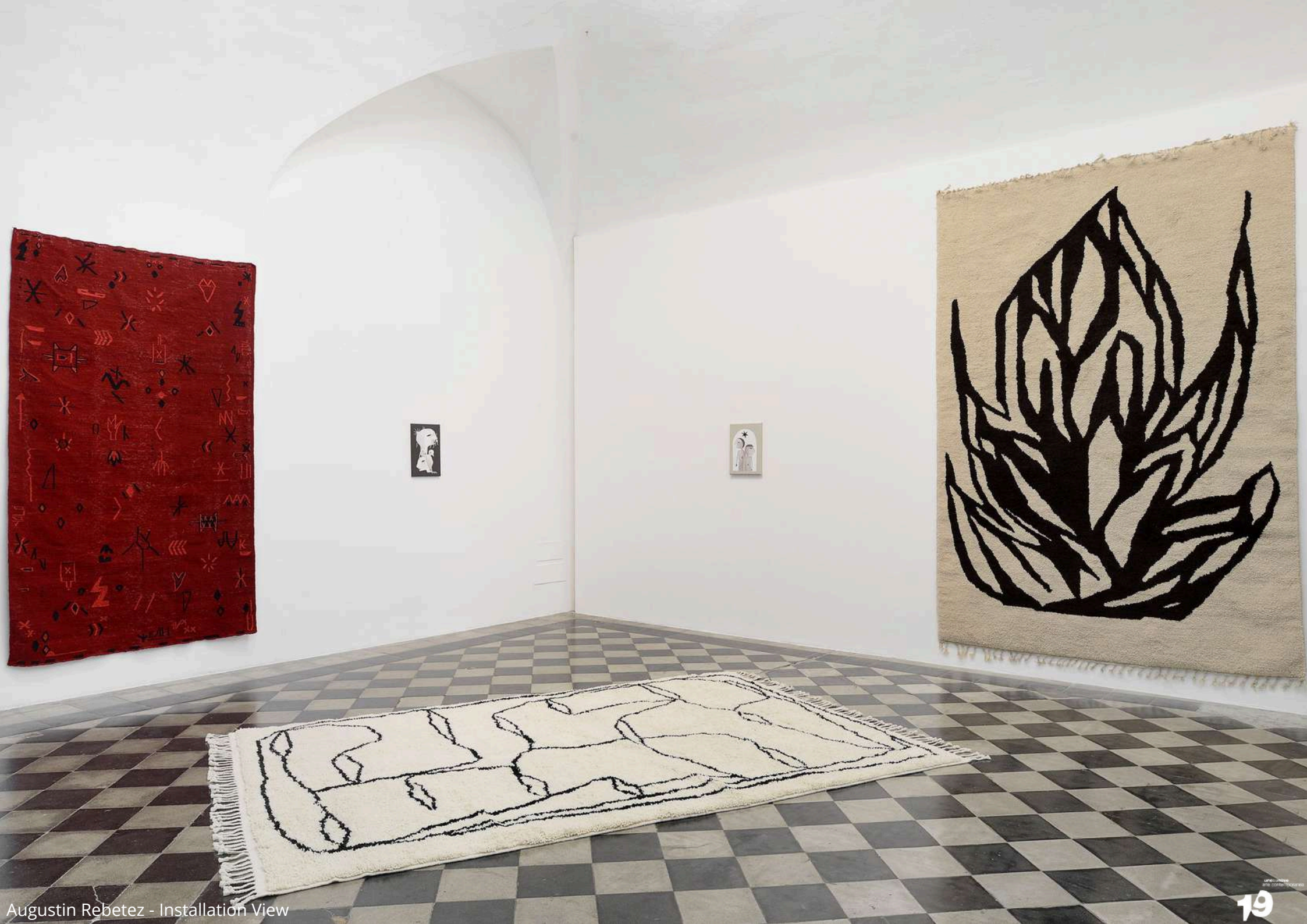
Augustin Rebetez - Installation View