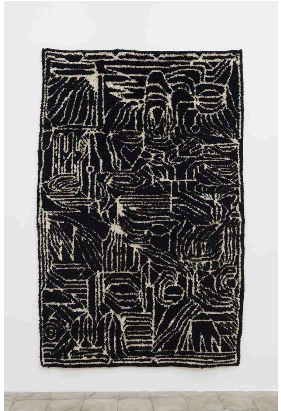
Augustin Rebetez maze #1 wool 150x250cm 2023