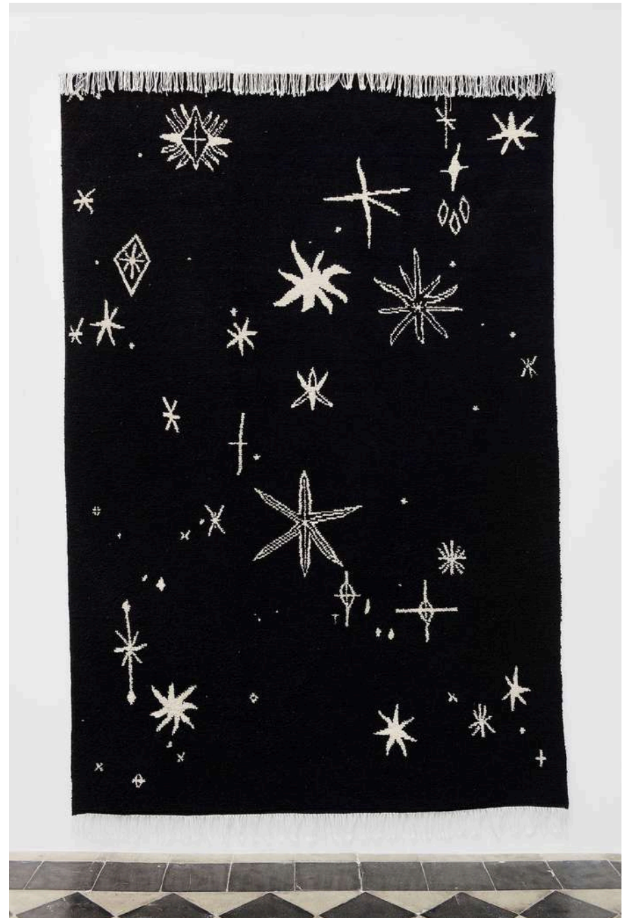
Augustin Rebetez stars #1 wool 300x200cm 2023