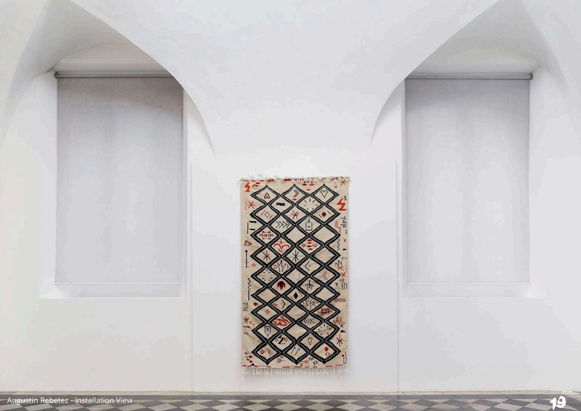
Augustin Rebetez - Installation View