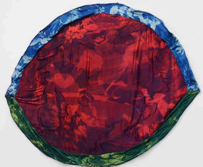
Tura Oliveira - Installation View