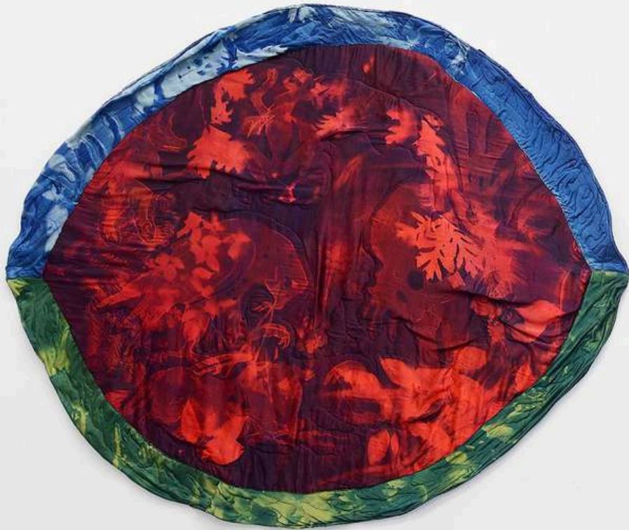
Tura Oliveira Falcon and Rabbit cyanotype on hand dyed silk 160x136cm 2024