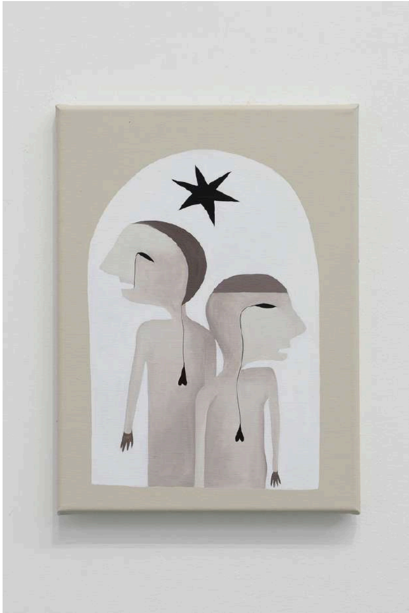
Augustin Rebetez Internal Relations #3 acrylic on canvas 30x40cm 2022