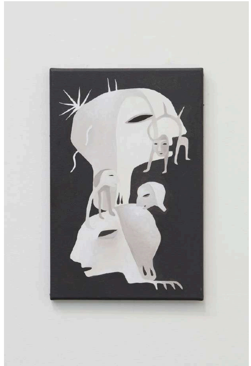
Augustin Rebetez Internal Relations #1 acrylic on canvas 27x41cm 2024