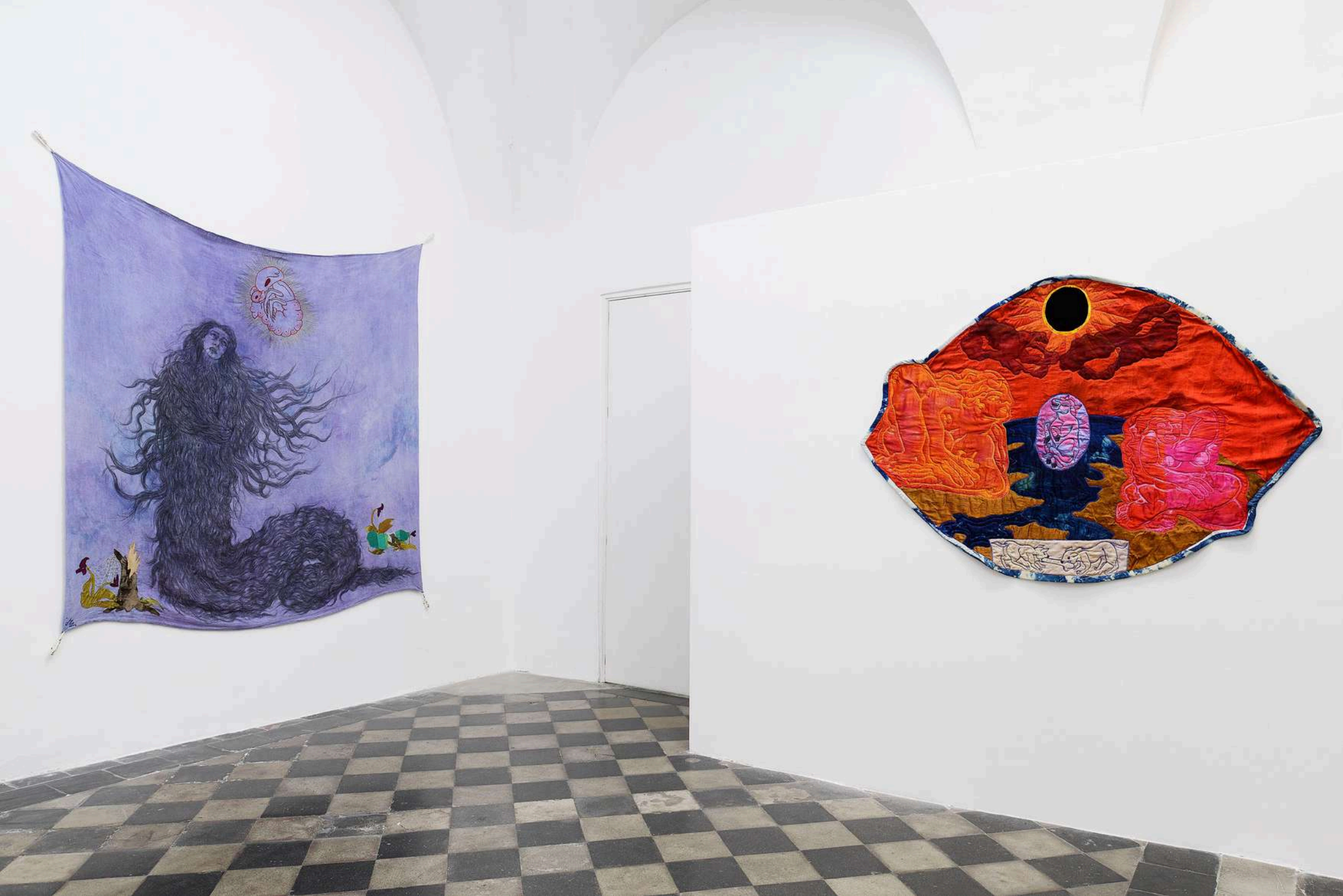
Tura Oliveira - Installation View