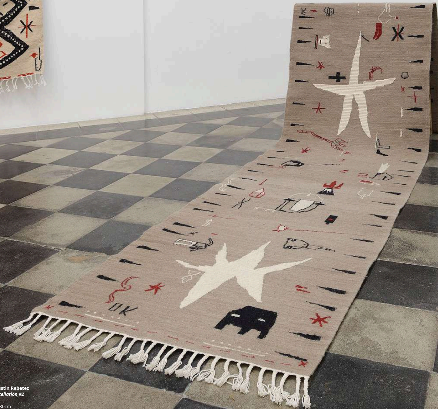
Augustin Rebetez constellation #2 wool 80x430cm 2023