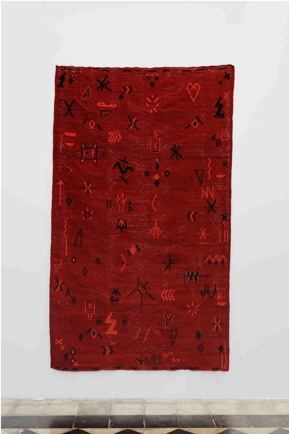
Augustin Rebetez constellation #1