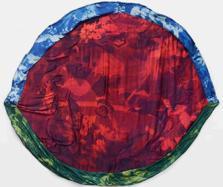
Tura Oliveira Demon Belly cyanotype on hand dyed silk 160x136cm 2024