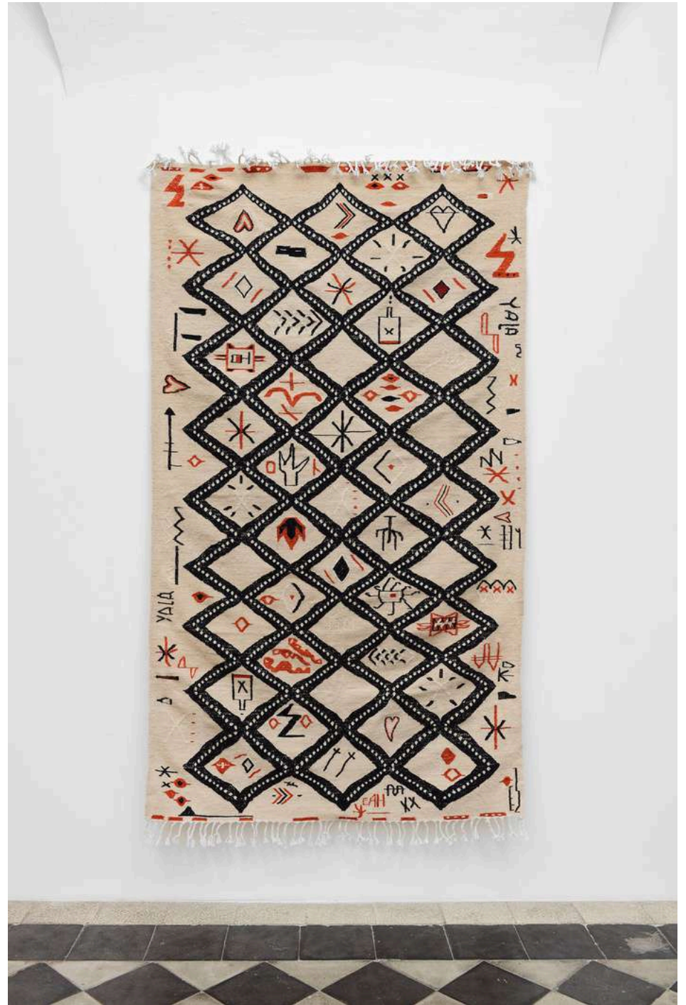
Augustin Rebetez constellations #3