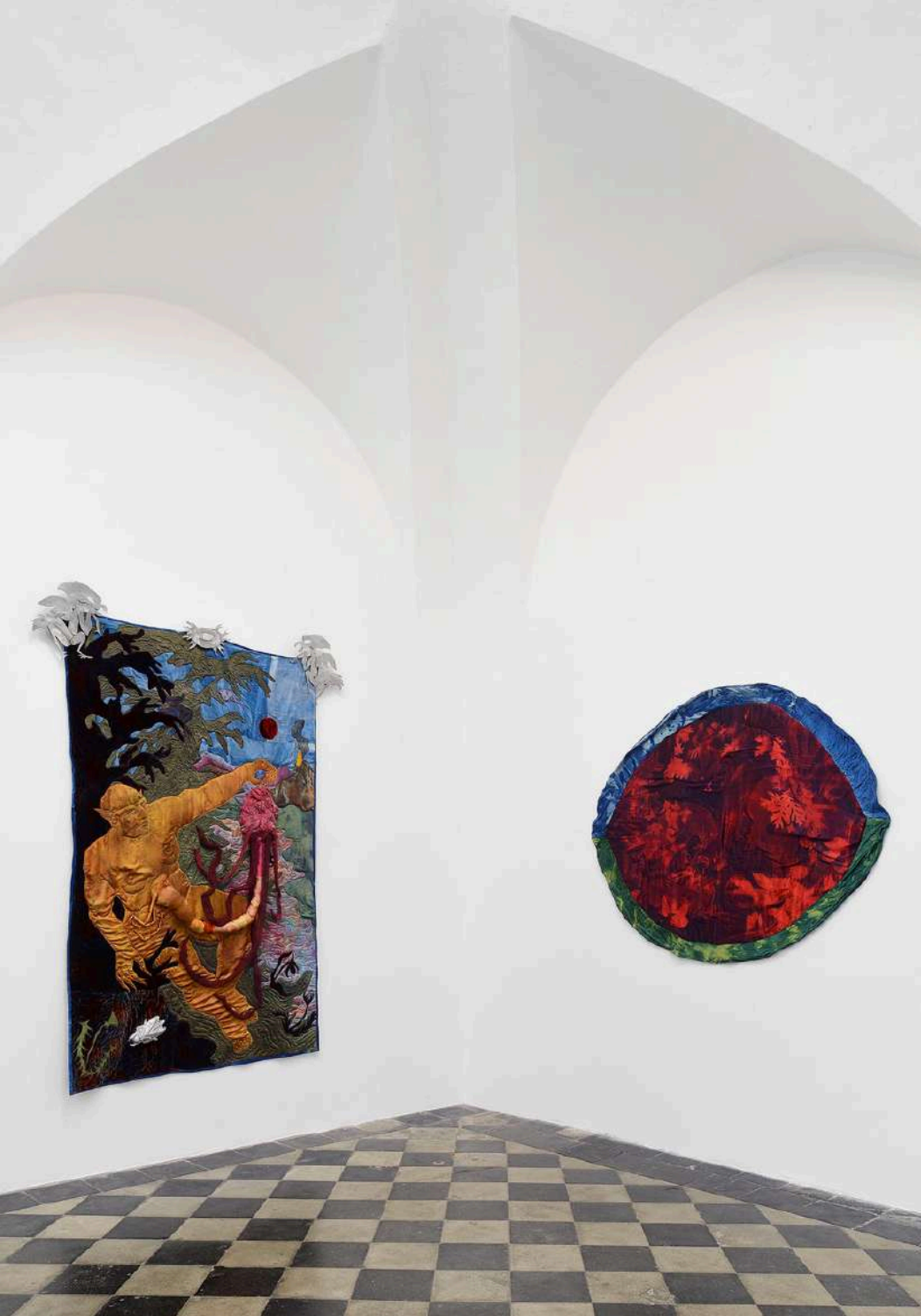
Tura Oliveira - Installation View