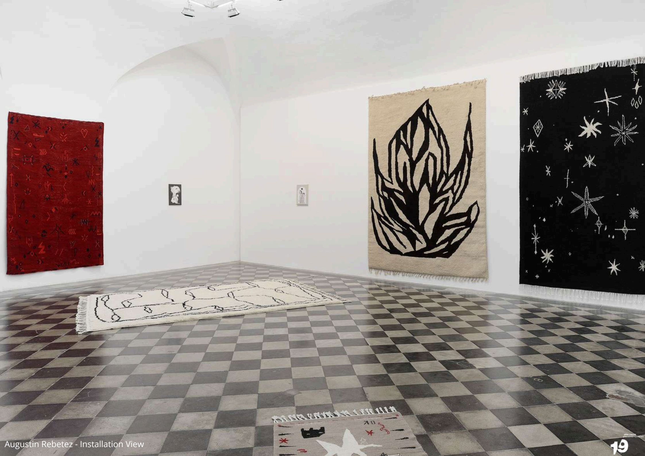
Augustin Rebetez - Installation View