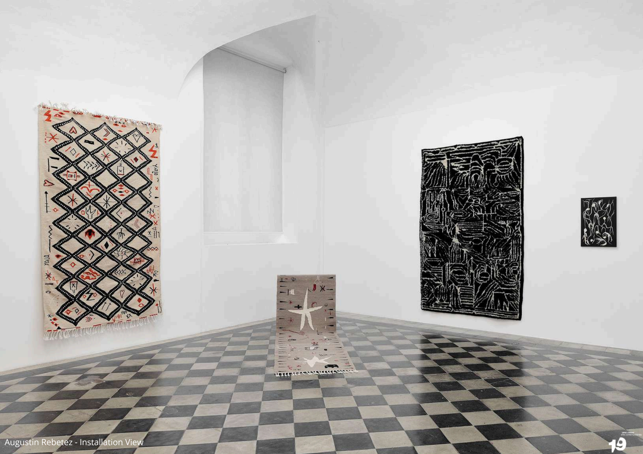
Augustin Rebetez - Installation View