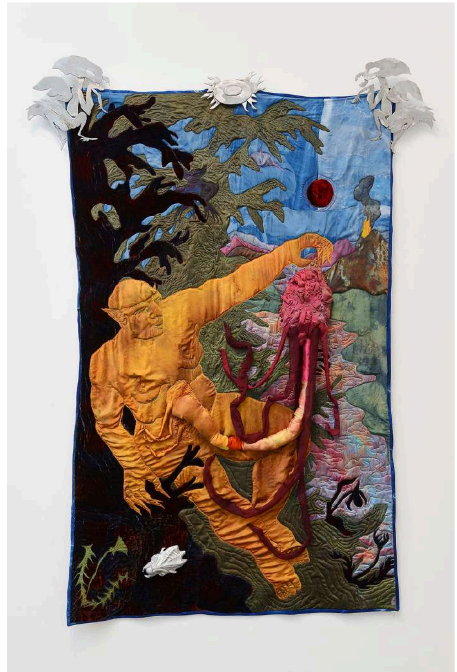
Tura Oliveira Stranded on this Planet like a Bitter Almond or an Olive Pit, She Finds Herself Miraculously Changed Hand dyed silk and silk velvet, cyanotype on silk, hand dyed cotton, cotton batting cotton thread, steel, cast aluminum 139.7 x 218.44 cm 2023