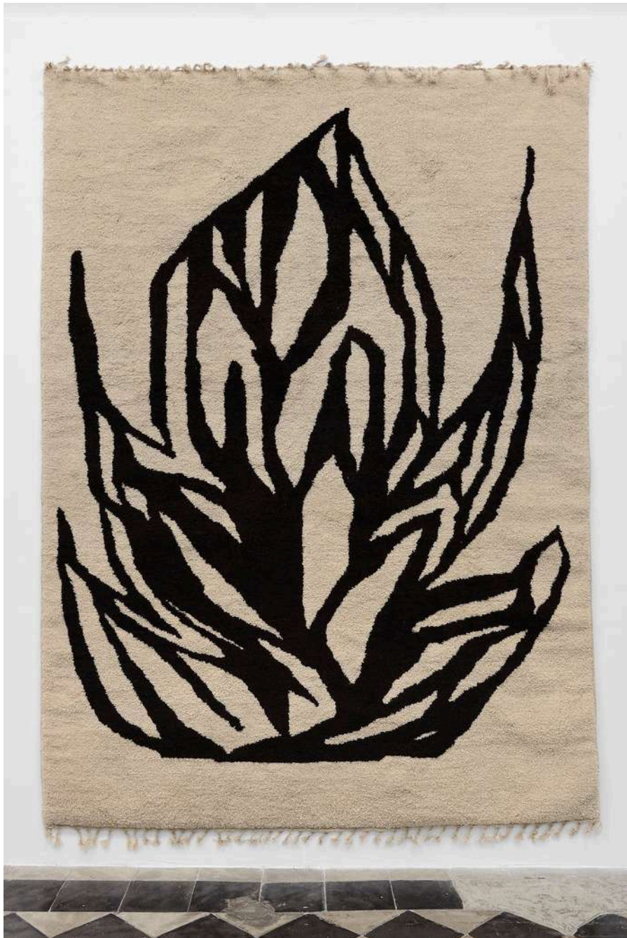
Augustin Rebetez fire #1 wool 200x300cm 2023