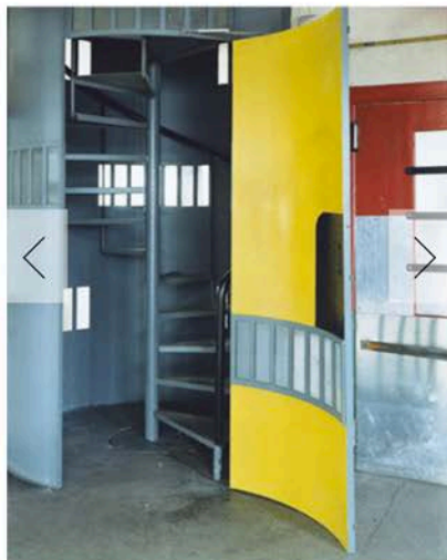
1 - 11 GUIDO GUIDI, USINE DUVAL (2003), STAMPA A CONTATTO, 20 X 25 CM (41,5 X 46,5 CM CON CORNICE), ED. 1/5

F ino al 24 giugno, presso la galleria 1/9unosunove di Roma, è allestita un'inedita installazione di scatti firmati dal fotografo Guido Guidi , che ritraggono i frammenti di un gruppo di edifici realizzati da Le Corbusier. Intitolata "Le Corbusier - 5 architetture" , la mostra ha tratto le fotografie in esposizione da un volume pubblicato da Einaudi nel 2003 per la collana "I Millenni" e intitolato Le Corbusier, Scritti , curato da Rosa Tamborrino.