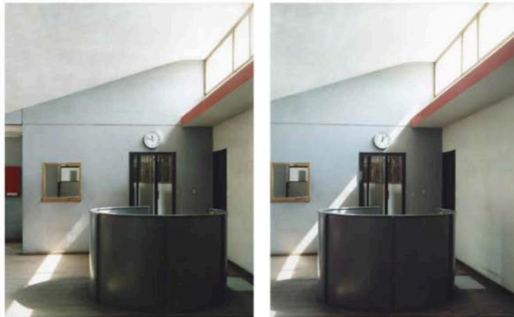
( http://www.bmiaa.com/wp-content/uploads/2017/06/AC.jpg ) Guido Guidi. Le Corbusier 5 architetture © Guido Guidi / Einaudi

Guidi's perseverance in framing the details of a place, the materials combined during the construction, the colors of the spaces, together with the notes glued on the walls or on the textile containers, deeply deals with a work that Le Corbusier had conceived for a different factory, a 'usine verte', as he wrote in the La Ville radieuse .