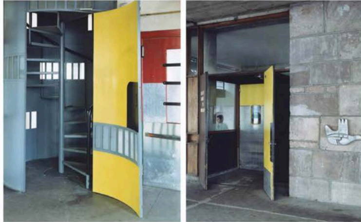
( http://www.bmiaa.com/wp-content/uploads/2017/06/AA.jpg ) Guido Guidi. Le Corbusier 5 architetture © Guido Guidi / Einaudi

The subjects chosen by Guidi from a long list of buildings cross the themes proposed in the introductory essay in a completely autonomous way. The marginal investigations on the main oeuvre – in the archives as well as in the photos – led to research on lesser-known works. The shots of Guidi reveal some of them nearly for the first time, such as the Duval factory .