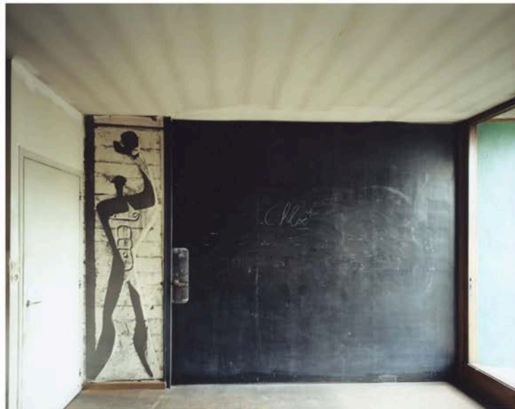
http://www.bmiaa.com/wp-content/uploads/2017/06/Documentation_Guido-Guidi_Le-Corbusier20.jpg Guido Guidi. Le Corbusier 5 architetture © Guido Guidi / Einaudi

The work of Guido Guidi is well aware of the deep interpretative value of the act of observation. In his photographs we are taken into Le Corbusier's work like never before: through detailed and partial views the photographer draws on the architect's lesser known work.