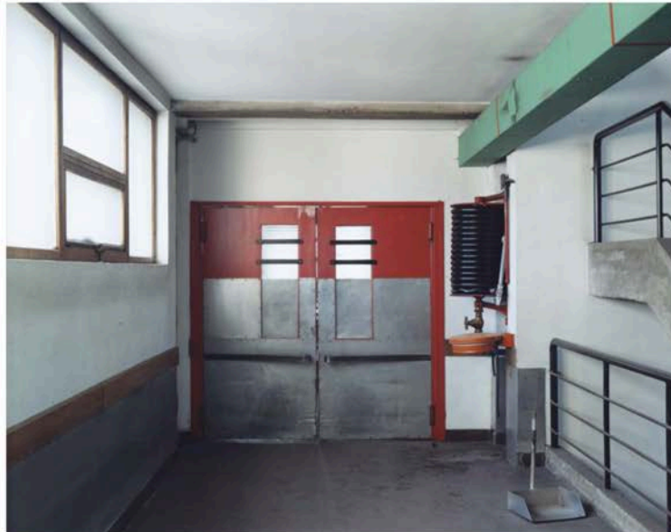
http://www.bmiaa.com/wp-content/uploads/2017/06/Documentation_Guido-Guidi_Le-Corbusier2.jpg Guido Guidi. Le Corbusier 5 architetture © Guido Guidi / Einaudi