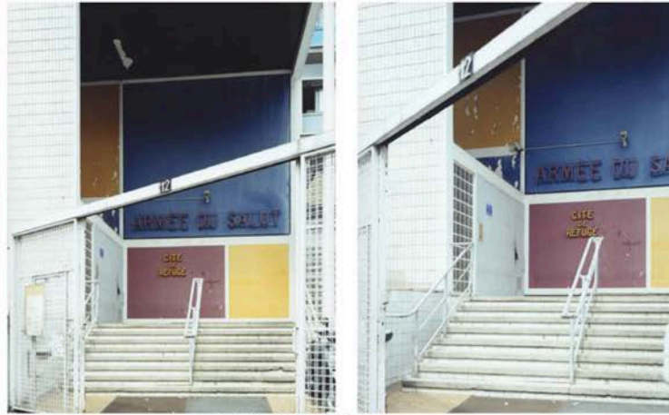
( http://www.bmiaa.com/wp-content/uploads/2017/06/AD.jpg ) Guido Guidi. Le Corbusier 5 architetture © Guido Guidi / Einaudi

The work that Guidi created for this project is far more expansive than what has been included in the volume. With this exhibit, an extensive selection of the reading of Le Corbusier by Guido Guidi is presented for the first time. Compared to the admittedly generous selection in the volume by Einaudi, this exhibit shows – not just quantitatively but also in its facets – a wider project and more interpretations.