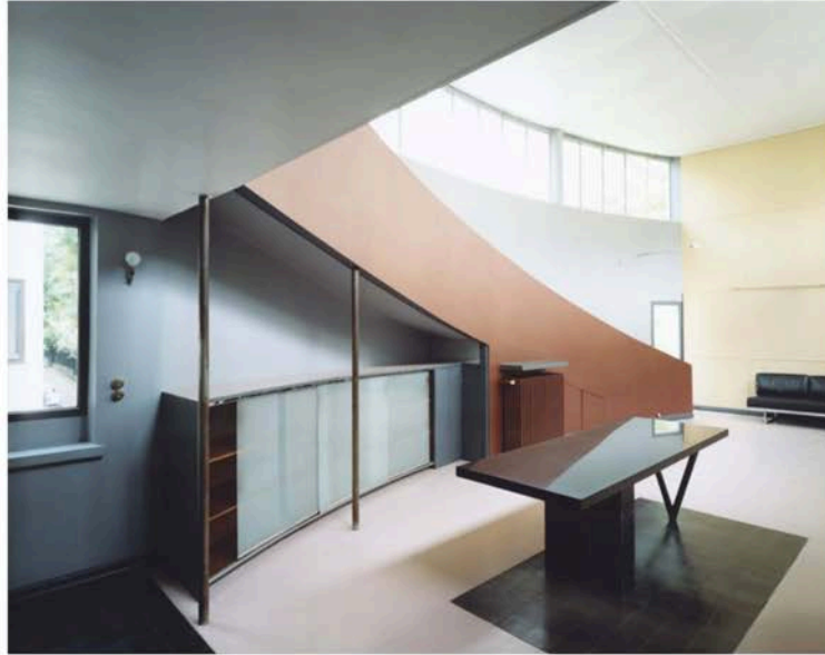
( http://www.bmiaa.com/wp-content/uploads/2017/06/Documentation_Guido-Guidi_Le-Corbusier15.jpg ) Guido Guidi. Le Corbusier 5 architetture © Guido Guidi / Einaudi