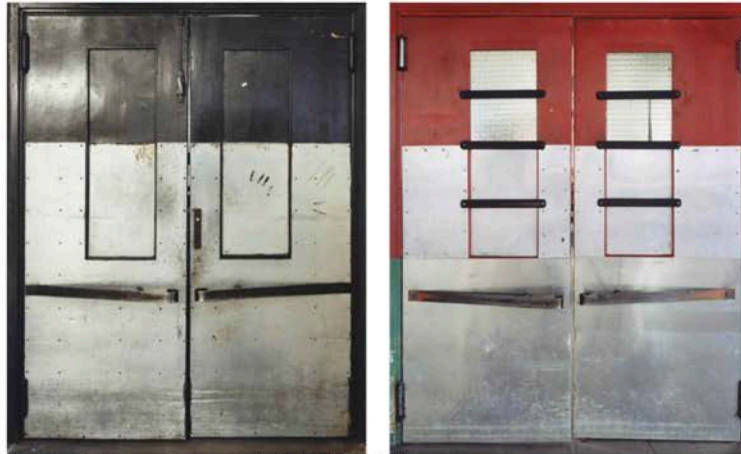
http://www.bmiaa.com/wp-content/uploads/2017/06/AB.jpg Guido Guidi. Le Corbusier 5 architetture © Guido Guidi / Einaudi