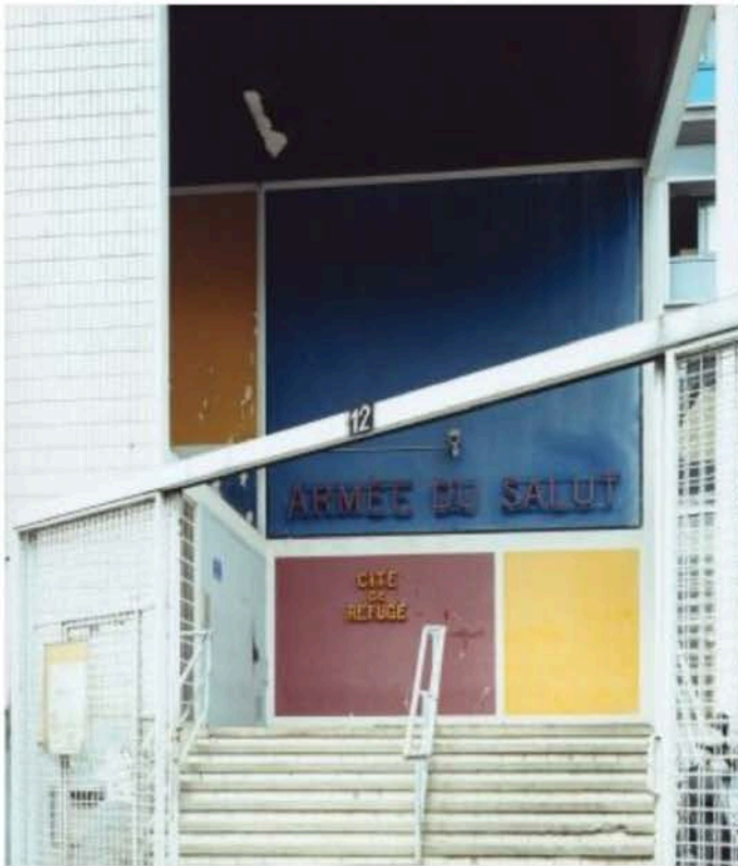
Guido Guidi, Cité de Refuge, 2003, stampa a contatto, 20 x 25 cm