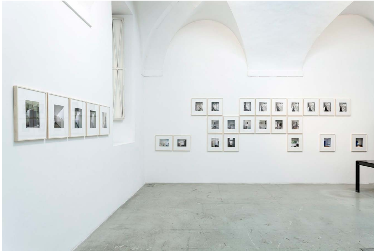
Guido Guidi, Le Corbusier _ 5 architetture, Installation view 1/9unosunove gallery

L'allestimento alla Galleria 1/9 unosunove, acquisisce l'immagine fotografica come una narrazione che si dispiega sulla parete, le parole non sono scritte, i caratteri non sono leggibili, ma si "riconoscono", la trama e il suo sviluppo si raccontano e ogni volta con le pause e gli a capi come fosse un salire e scendere dai piani dell'edificio che si attraversa e si contempla con calma e poetica respirazione.