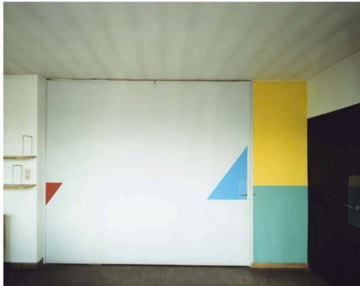
( http://www.bmiaa.com/wp-content/uploads/2017/06/Documentation_Guido-Guidi_Le-Corbusier21.jpg ) Guido Guidi. Le Corbusier 5 architetture © Guido Guidi / Einaudi